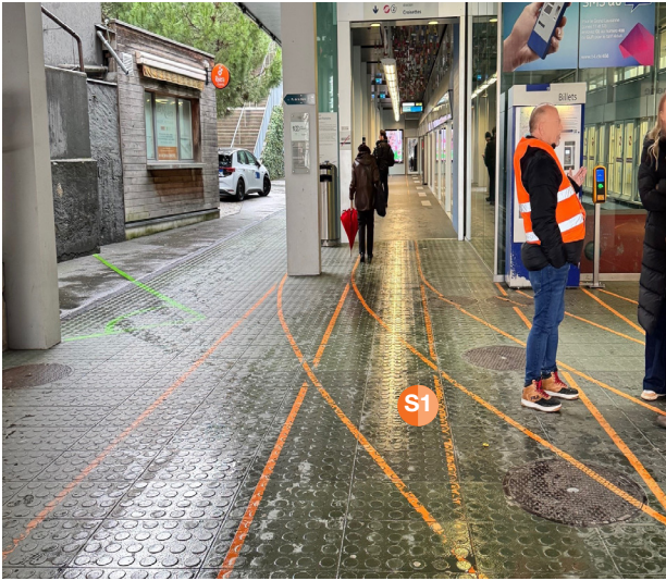
S1 1ère demi-place de distribution, max. 2 promoteurs, station Lausanne-Ouchy.