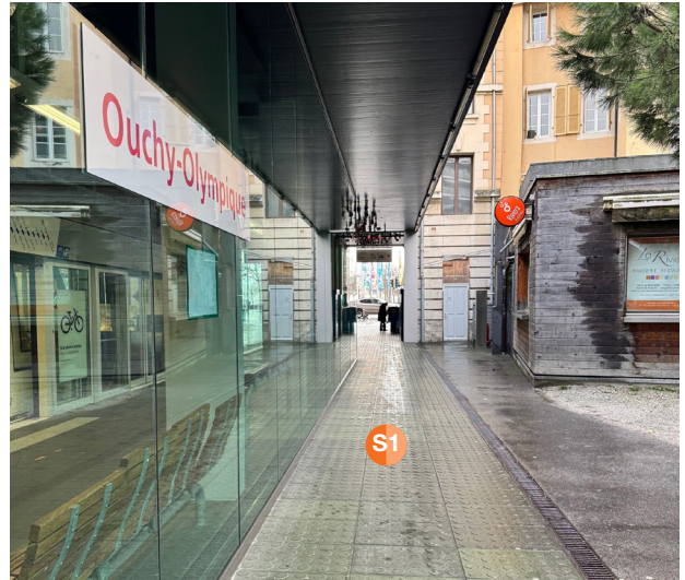
S1 2° mezzo punto di distribuzione, max. 2 promotori, stazione di Lausanne-Ouchy.

Attenzione: l'area di campionamento è solo sotto la tettoia.