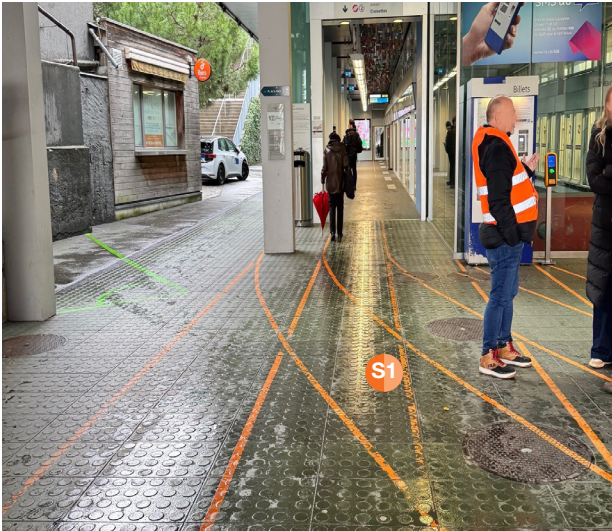
S1 1° mezzo punto di distribuzione, max. 2 promotori, stazione di Lausanne-Ouchy.