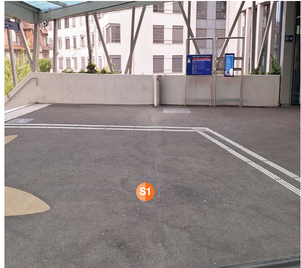
S1 2. mezzo punto di distribuzione, sul ponte pedonale all'uscita verso la piazza della stazione, max. 2 promotori