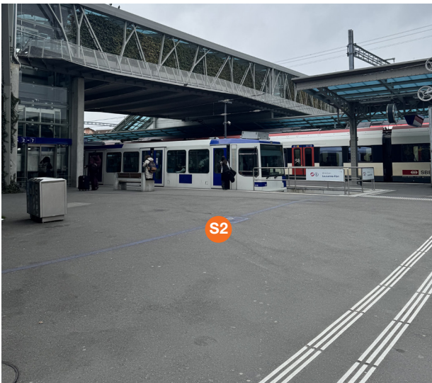
S2 Punto di distribuzione, piazza della stazione, Passaggio Ovest