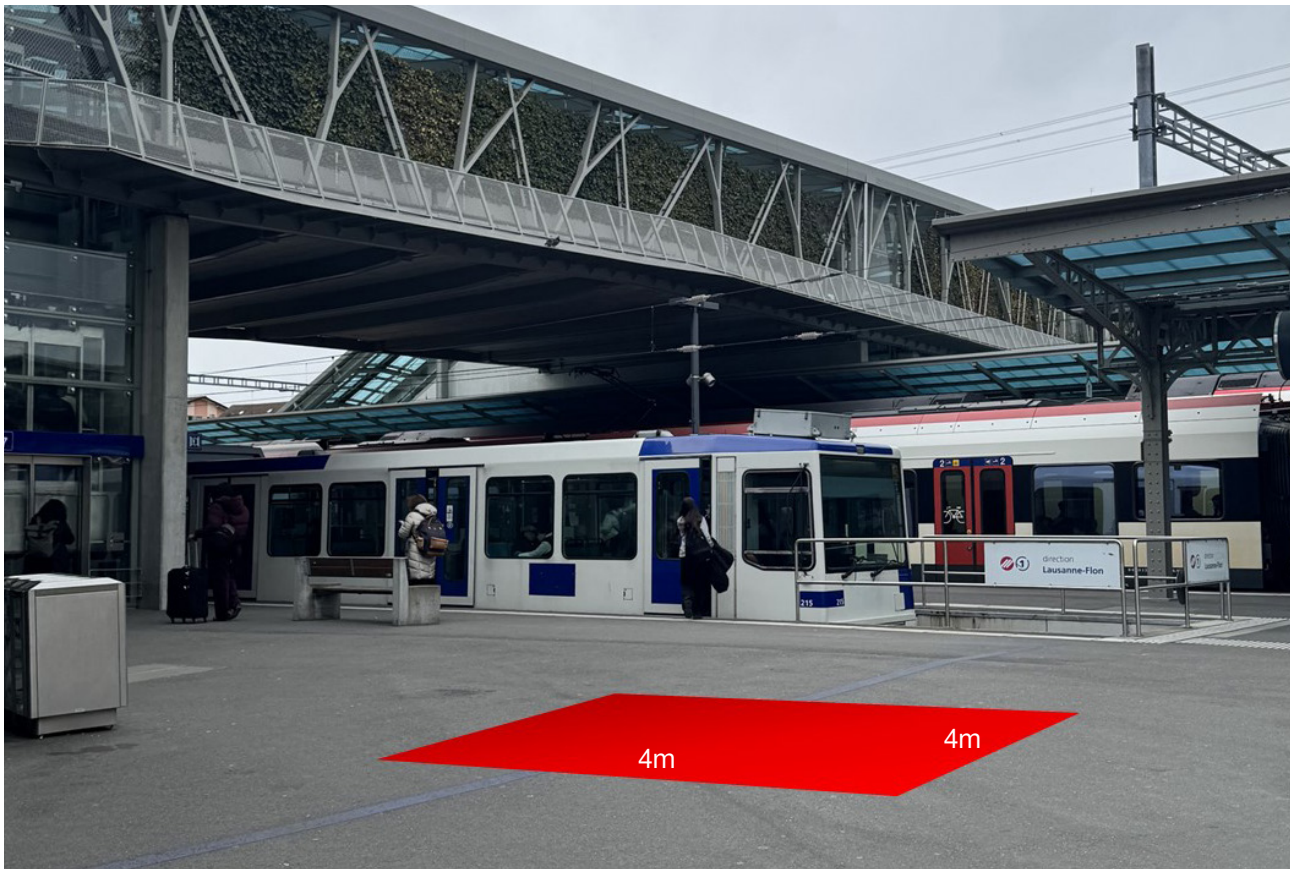
P1 Stand promozionale, Piazza della stazione, Passagio Ovest 4 x 4 = 16m 2